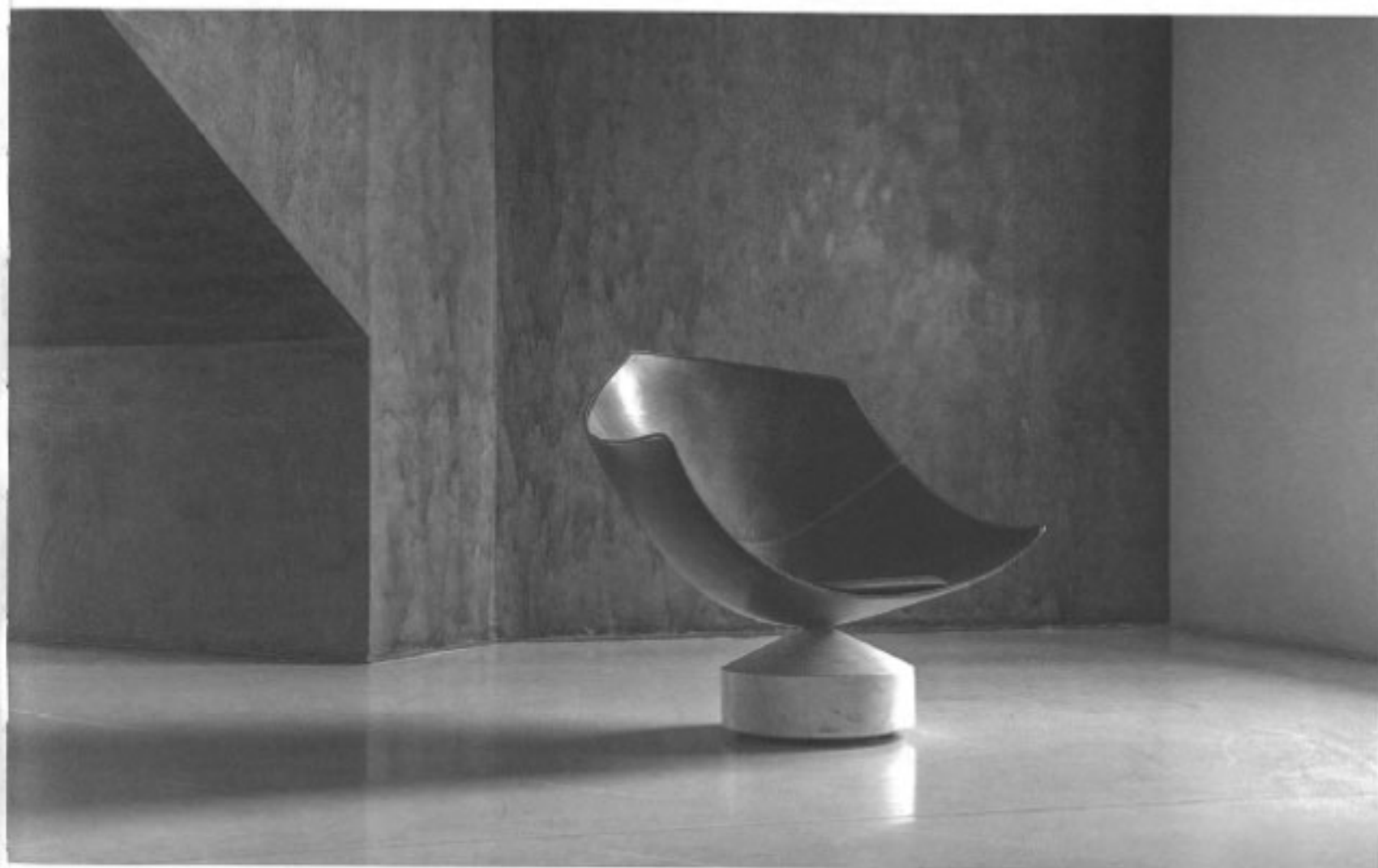
Jengada, Babled Design