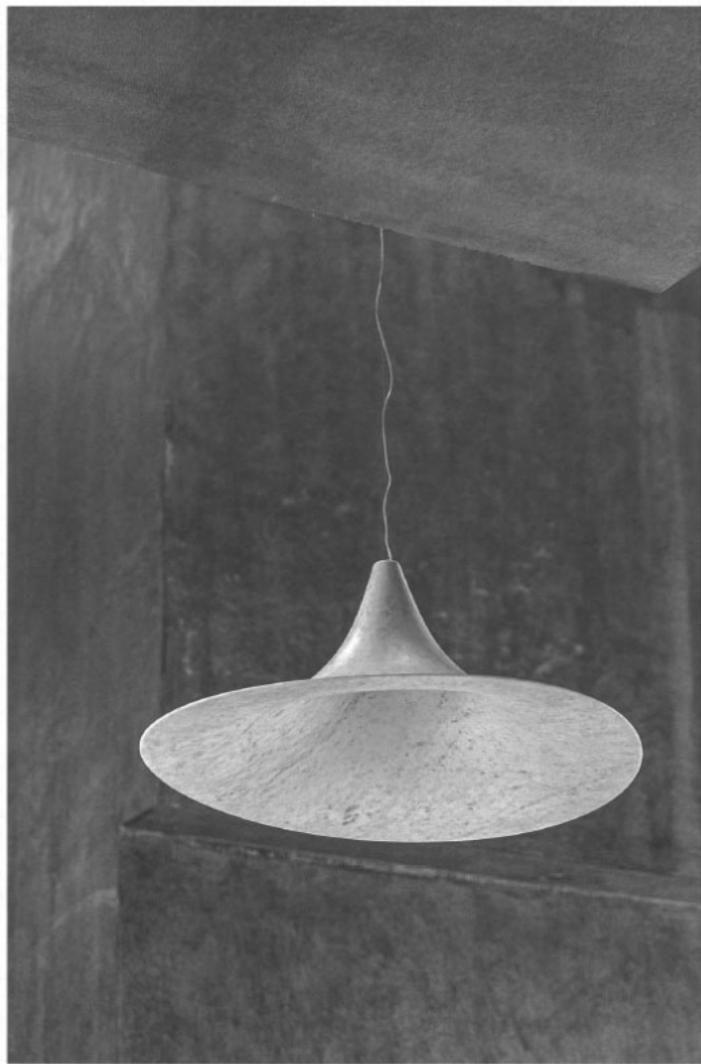
Supernova, Bablied Design