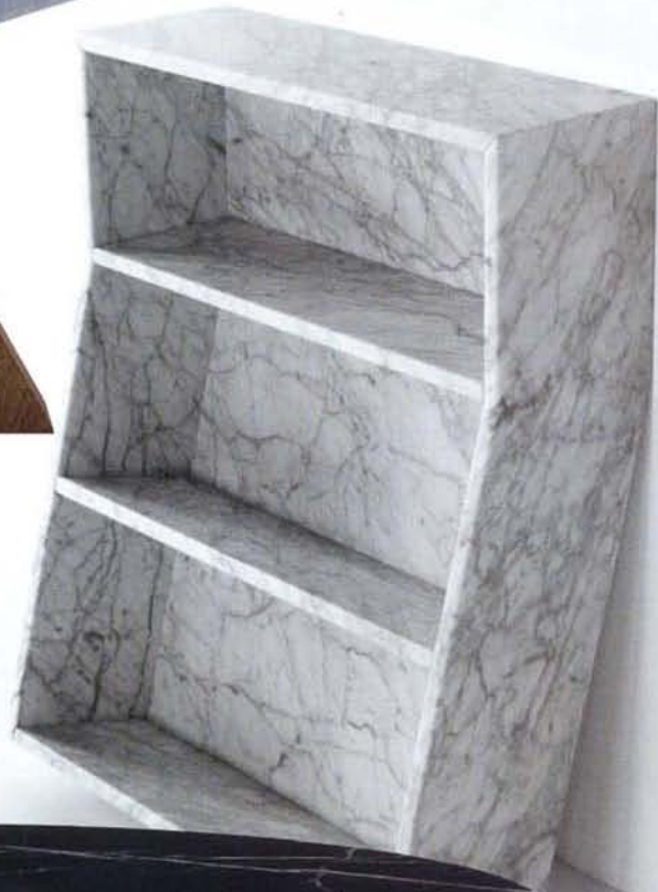
3. Eccentrico Angelo Mangiarotti AGAPE CASA