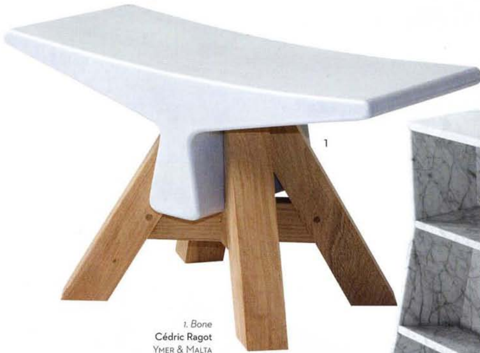
1. Bone Cédric Ragot YMER & MALTA