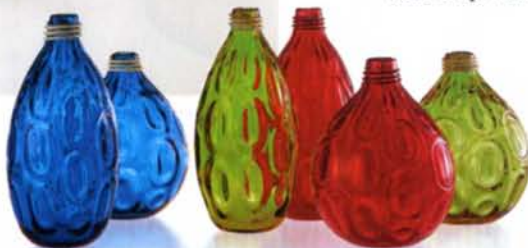
▶ Klaasist objekti sünd Venini tehase meistrite "ballettrupi" esituses.