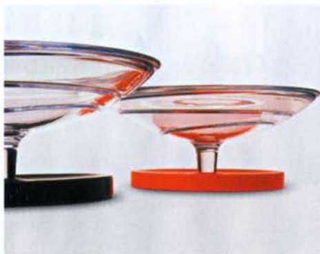
Hypnos, Prantsuse firmale Baccarat kavandatud kristallist ja corianist toode, 2001.

Lylian Meister Fotod Katarina Meister, tootjad