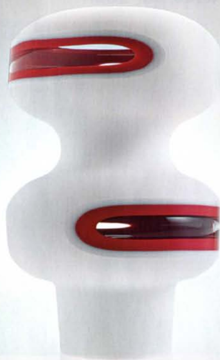
▲ Ring Tower II, vaas sarjast Toys, Unit, toodetud Veninis, 2004.