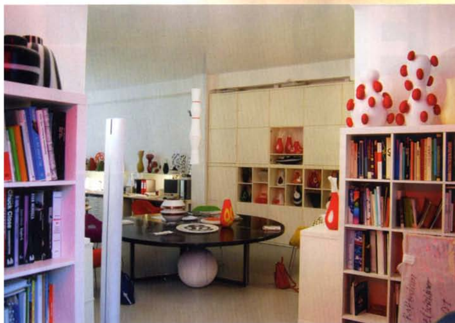
▼ Emmanuel Babledi studio Milanos on inspireeriv koht.