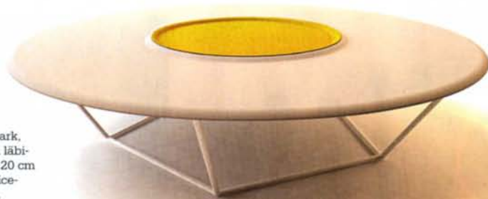
► Central Park, madal laud läbimõõduga 120 cm firmale Felice-rossi, 2007.