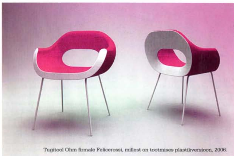
Tugitool Ohm firmale Felicerossi, millest on tootmises plastikversioon, 2006.

▼ Sofa Panorama firmale Felicerossi, mida esitleti 2007. a kevadel Milano mööblimessil. "Hull projekt. Püüan tootedisaini ikka mingit visiooni tuua. See siin on välgast minimalistlik karm ristkülik, mille sisu vastupidine: 9 ümarat patja hoolitsevad sinu eest ja istudes on tunne nagu kookonis."