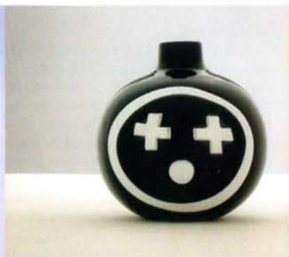
Vaas Happy Few II, toodetud Muranos Anfora fornaces, 2002.