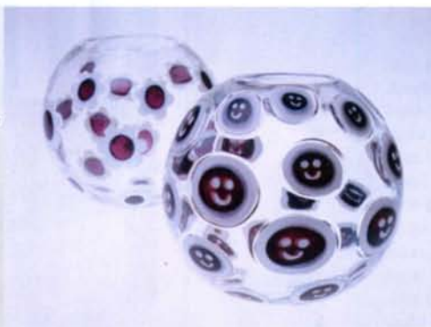
Vaas Happy Few I, toodetud Muranos Anfora fornaces, 2002.