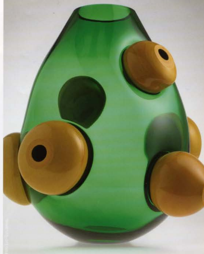
Megalit Buttons Babled