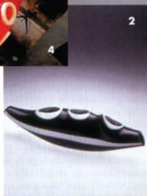
1 Люстра Comete, Venini, 1997 год. 2 Прототип новой вазы для Oxygen. 3 Блюда из коллекции Nurpos для Vassarat. 4 Процесс производства вазы Waikiki из коллекции Millennium для Venini.

В 2001 г. Vassarat открывает перед дизайнером путь к хрусталу. На свет появляется коллекция Nurpos: чаши, подсвечники, настольные и настенные часы, простые линии, плавные контуры. Баблед превосходно играет в эти прозрачные игры. Но этого ему кажется мало, и он соединяет хрусталь с корианом: «Я хотел создать мощный контраст между хрусталем — природным материалом, известным с античности, и корианом — современным синтетическим материалом, выбранным за свою долговечность и необыкновенную, почти мраморную чистоту. Стекло? Это материя одновременно неблагодарная (никогда не выходит то, чего хочешь) и великодушная (получается лучше, чем задумывал)», — говорит Баблед. И все-таки при всей своей любви к стеклу Эммануэль не желает становиться его рабом: «Каждый материал, каждая техника — это сокровище, из которого благодаря фантазии вырастает неповторимая «личность» объекта. Стекло, конечно, великолепная опора для выражения форм и идей, но это тяжелый, сложный, хрупкий, отнюдь не идеальный материал, скажем, для софы. Да и сам я, в первую очередь, дизайнер, а не стекольных дел мастер». Что правда, то правда. На последнем Миланском салоне Баблед представил коллекцию мебели и инсталляцию Poker Lounge из кориана. А еще он курирует крупные выставки, сотрудничает со