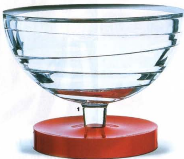
1. Coupe en cristal et Corian®, collection “Hypnos”, Baccarat, 2002.